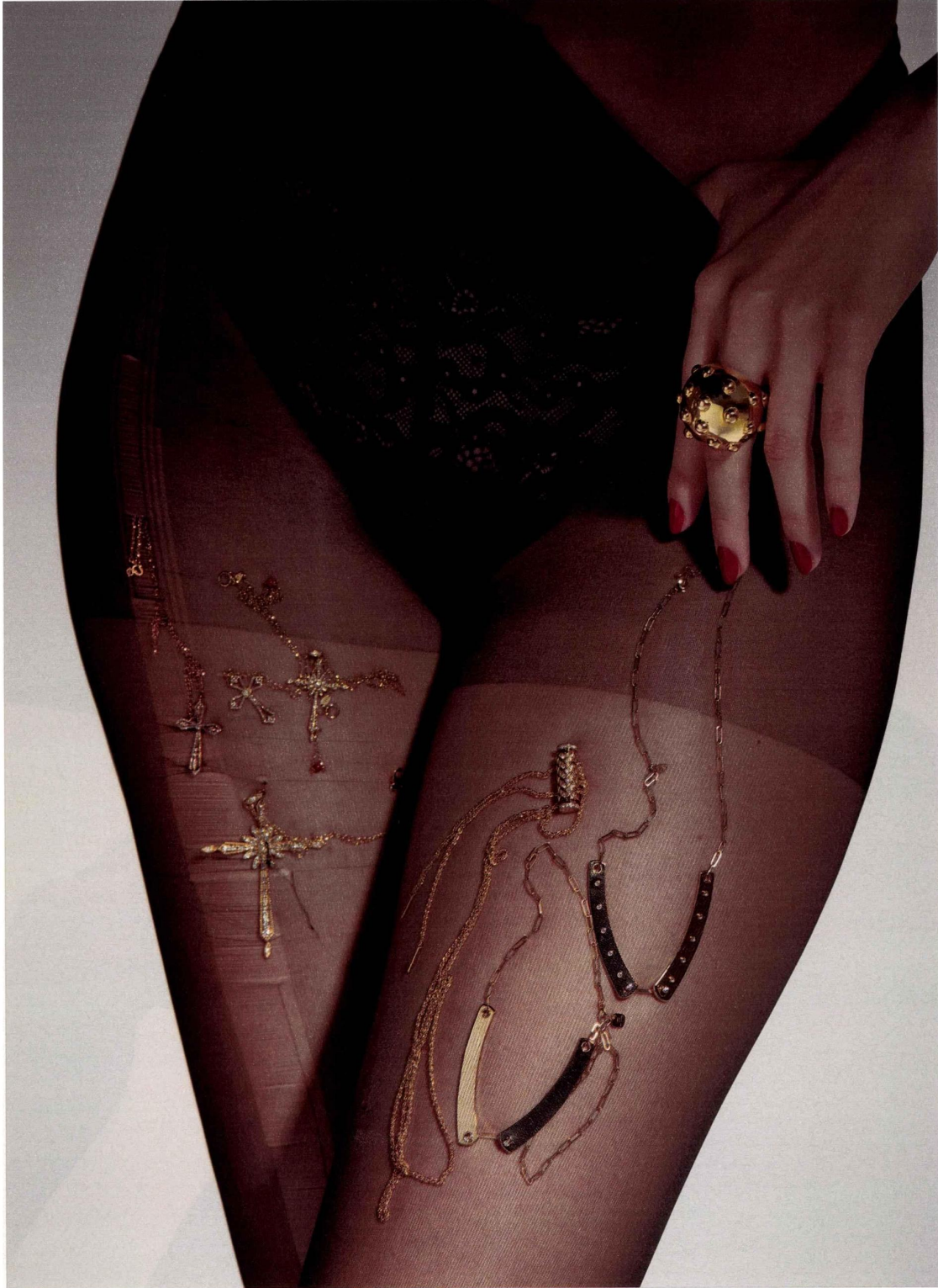
Collants Calzedonia , culotte Intimissimi . Bague Guerre des boutons en or jaune Garnazelle . Sous les collants, à gauche : colliers collection Universu en or jaune 18 carats recyclé Maria Battaglia . A dr. : sautoir Latch en or jaune pavé de diamants, collier Mood brunch en or jaune et diamants, collier Mood Business Meeting en or jaune, les trois Nouvel Heritage .