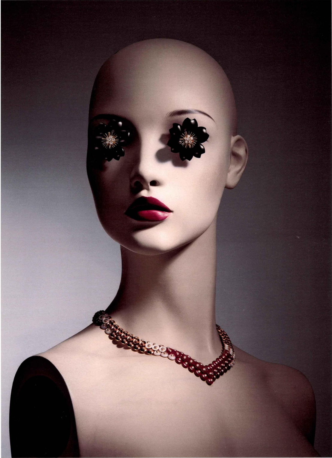
Collier Bouton d'or en or rose, cornaline, diamants et nacre, clips en or jaune, diamants et onyx, le tout Van Cleef & Arpels .