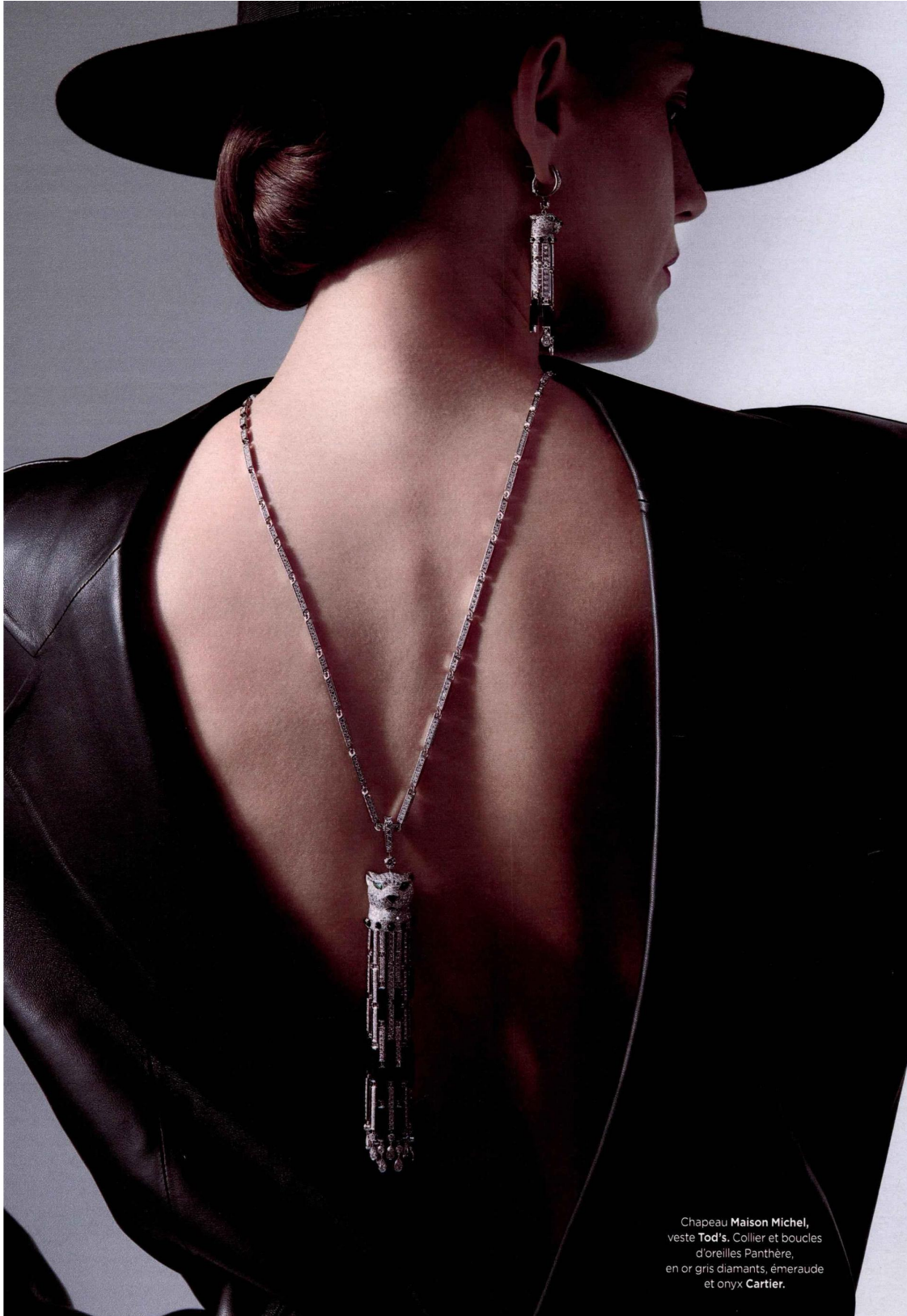
Chapeau Maison Michel , veste Tod's . Collier et boucles d'oreilles Panthere , en or gris diamants, émeraude et onyx Cartier .