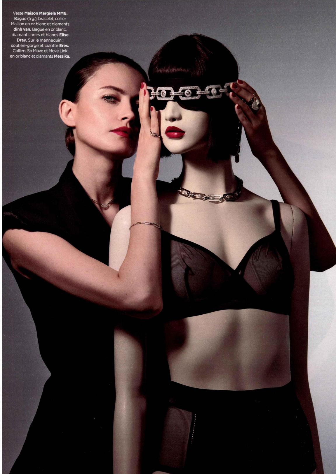
Veste Maison Margiela MM6. Bague (à g.), bracelet, collier Maillon en or blanc et diamants dinh van . Bague en or blanc, diamants noirs et blancs Elise Dray . Sur le mannequin : soutien-gorge et culotte Eres . Colliers So Move et Move Link en or blanc et diamants Messika .