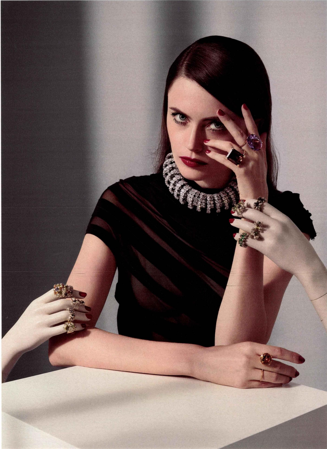
Robe Mugler . Collier et boucles d'oreilles Swarovski . Bagues Double Jeu en or rose, diamants, saphirs jaunes, citrine et quartz fumé Isabelle Langlois . Sur les mains en plastique: bagues Fragments en argent, pierres fines et précieuses, Meteor Jewels .