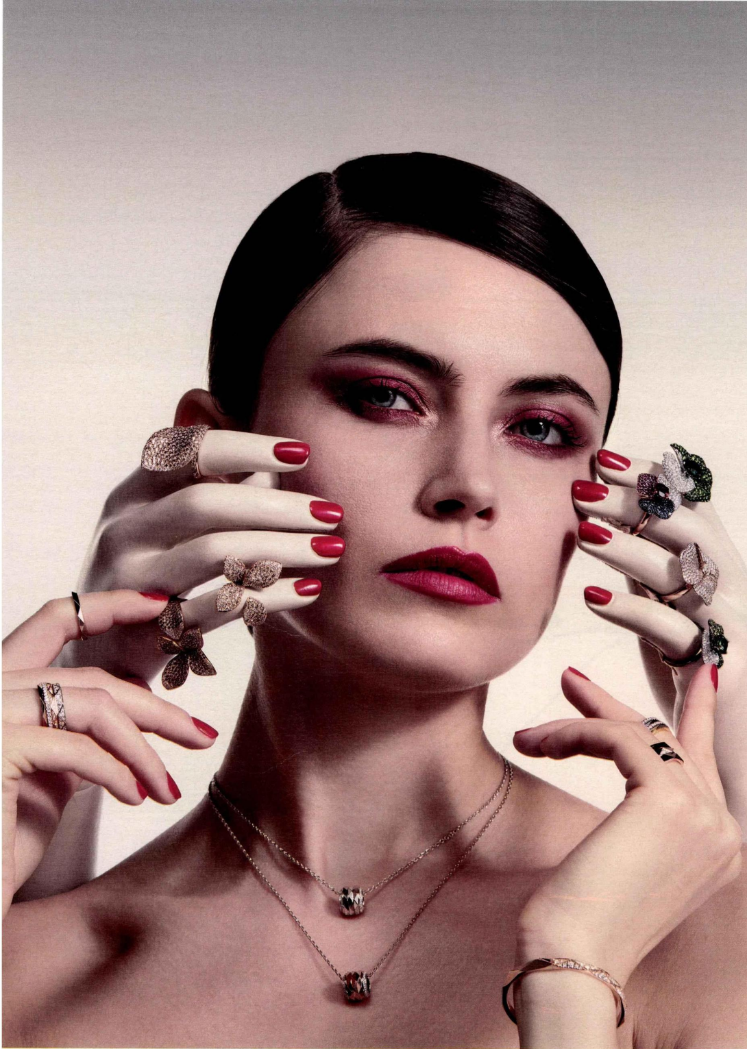
Colliers à pendentifs en or rose, blanc et diamants, alliances en or jaune, rose, blanc, avec et sans diamants, bracelet en or rose et diamants, le tout Laurence Graff signature, Graff . Sur les mains en plastique, à gauche : bague Aleluiá XL et deux bagues Giardini Segreti, en or rose, diamants blancs et bruns, les trois Pasquale Bruni . A droite : bagues Bloom en or jaune, diamants blancs et verts, saphirs bleus et roses, le tout AS29 .