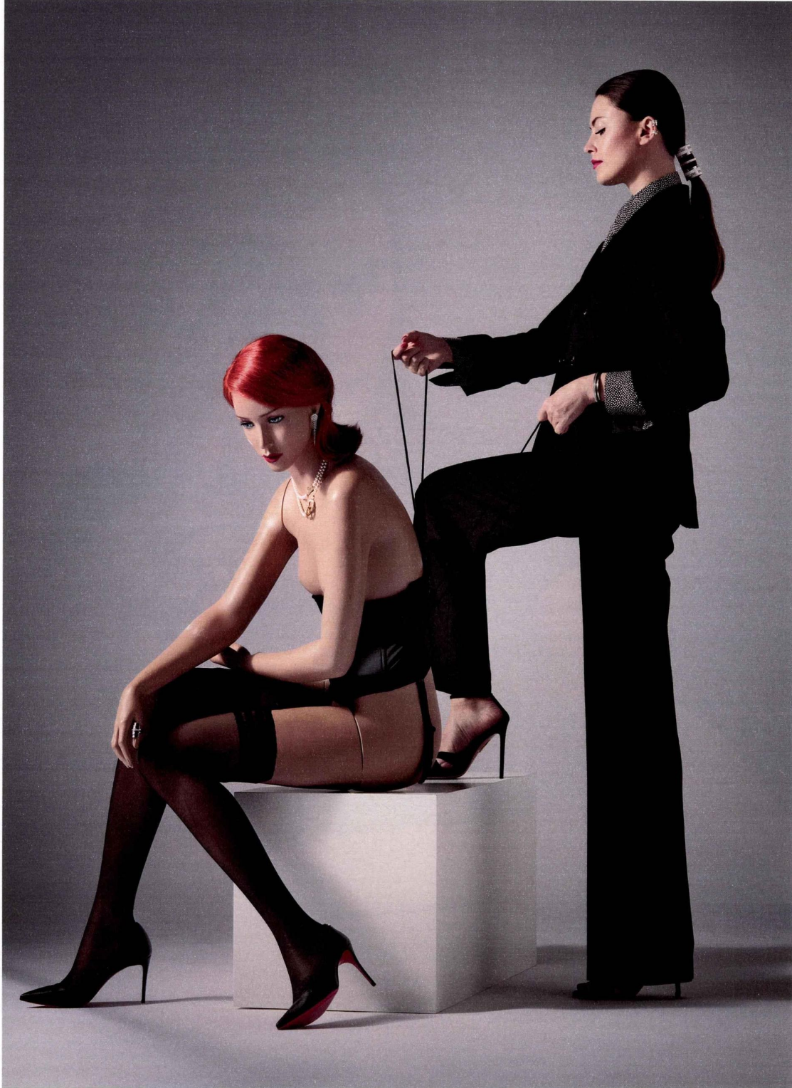
Costume, chemise et cravate Paul Smith , escarpins Aquazzura . Bijou de cheveux Quatre Double White Edition en diamants, or blanc et céramique, clips d'oreilles Quatre classique en or blanc, rose, jaune et diamants, bracelet Quatre Black Edition en diamants et or blanc, le tout Boucheron . Sur le mannequin : serre-taille Cadolle , bas Falke , escarpins Christian Louboutin . Bague My Way, colliers Entre-Maille en diamants et perles, boucle d'oreille Stairway XL en argent et diamants, le tout Statement .