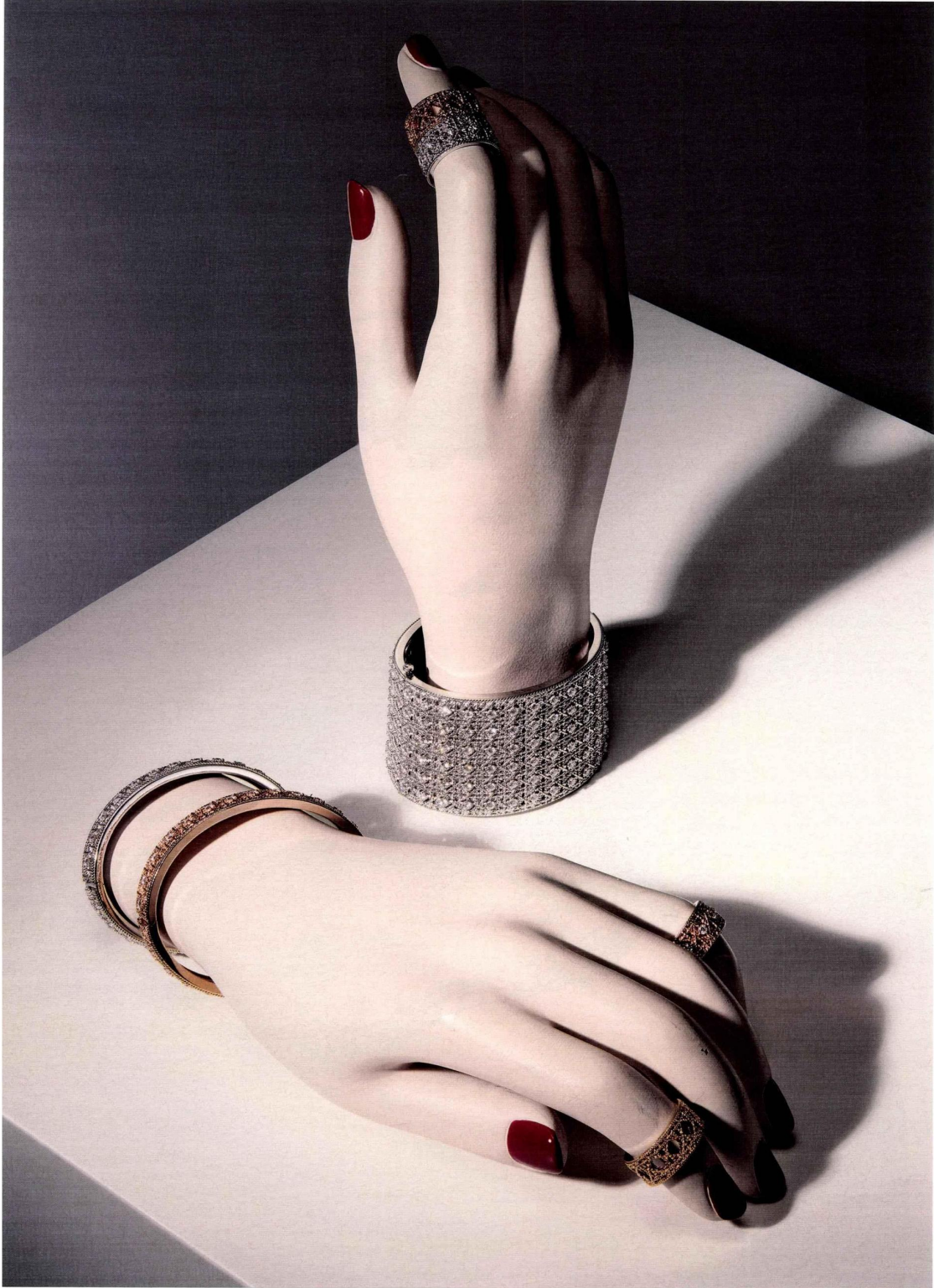
Manchette, bracelets et bagues My Dior en or rose, jaune, blanc, et diamants, le tout Dior joaillerie .