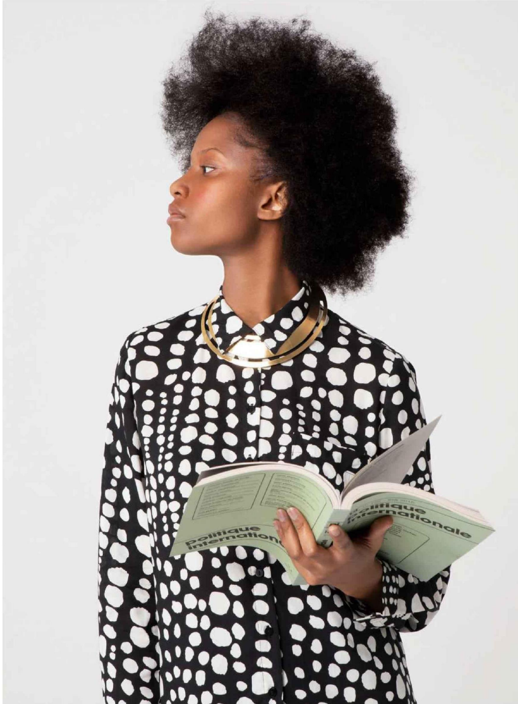
(Ci-dessus) Diamy . Chemise, Bonprix . Collier torque, Isabelle Toledano . (Ci-contre) Ilona . Robe, Twinsset . Bottines, Tamaris . Pia . Robe, Phème Paris . Bottes, Spartoo . Boucles d'oreilles, Histoire d'Or .