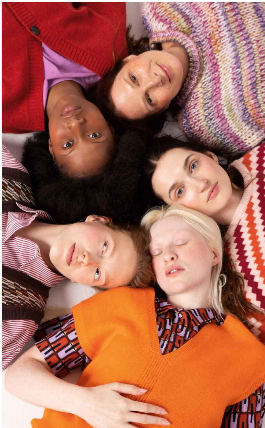
Diamy. Tee-shirt, American Vintage . Cardigan, Uniqlo . Marie. Pull, Molly Bracken . Pia. Pull, La Française . Boucles d'oreilles, Histoire d'Or . Jessica. Pull, Oakwood . Top, Monoprix . Ilona. Pull, La Redoute . Chemise, Bella Jones .